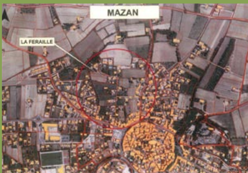
Le quartier de la Feraille

investir et s'endetter pour se loger tourne autour de 150 000 € pour les primo-accédants et à un peu plus de 200 000 € pour les couples quadragénaires, offrant sur le marché libre immobilier respectivement des logements de 60 et 80 m 2 ... Quand on sait que des terrains à bâtir de 1800 m 2 ont été négociés à 180 000 €, on prend conscience du fossé qu'il reste à combler.