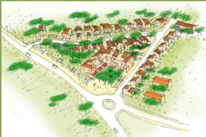
Première esquisse envisagée sur le quartier de la Bruyssande