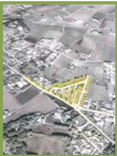
Situation du quartier de la Buysande