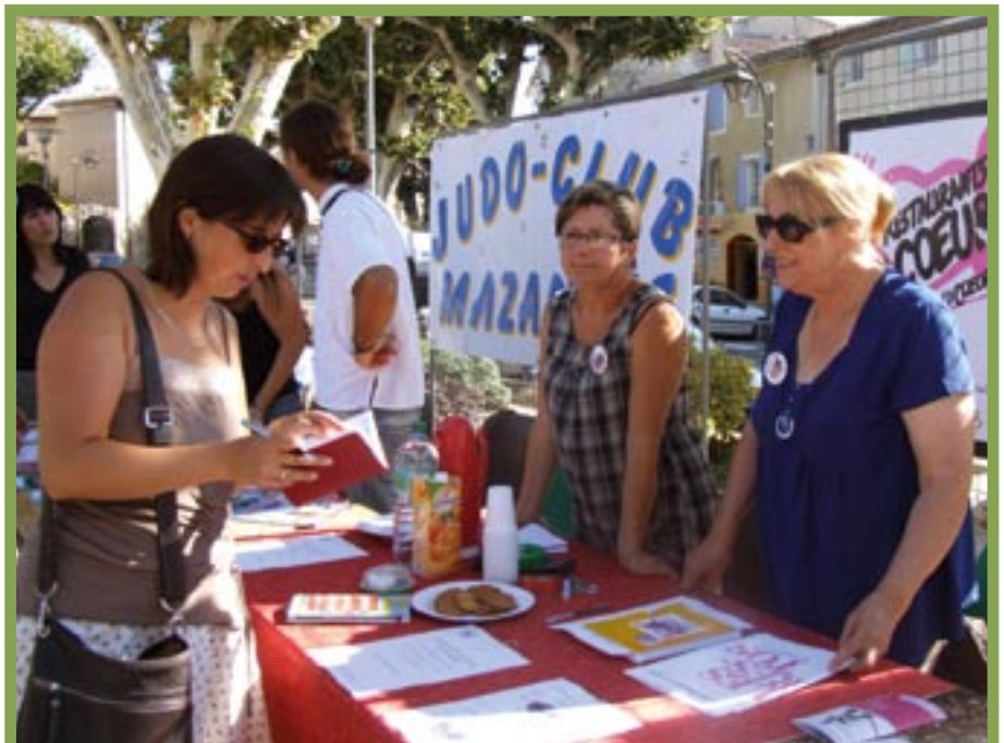
Les Restaurants du cœur