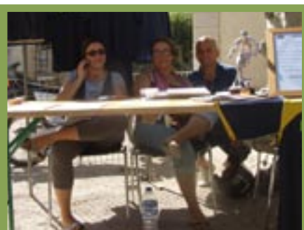
Le stand SC Foot Mazan