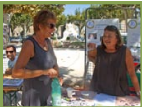
Le stand Atousports

que la vie associative crée du lien social en facilitant l'intégration des populations autochtones et de celles venues d'ailleurs, et qu'elle se doit de gommer toute forme de discrimination. Elle participe aussi à l'attractivité de la commune et à l'image que s'en font ses ressortissants, elle constitue un ciment et un ferment de la formation civique des populations, tout en portant haut les valeurs sportives et morales, en un mot les valeurs humaines.