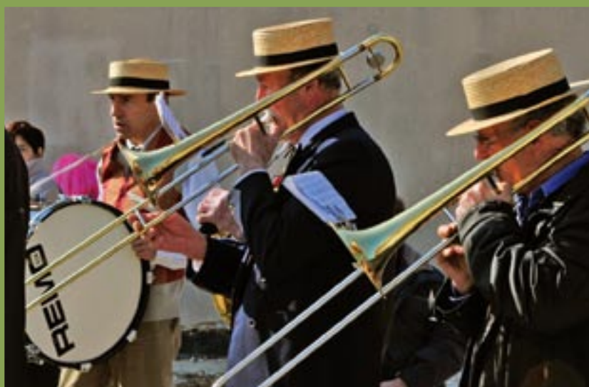
La Philharmonique mazanaise, la doyenne des associations

Peut-être la moins connue ? L'attrait pour les arts martiaux ne se dément pas, au vu du nombre de clubs qui les pratiquent. A un point tel que la municipalité réfléchit à la réalisation future d'un nouveau dojo, dimensionné véritablement à la demande locale, voire au-delà. OSUKAI France Mazan Karaté est sans doute le club le moins connu. Il dispense le karaté d'Okinawa, sous le haut patronage de Maître Chinen, champion japonais installé à Paris depuis 1976. Au-delà des aspects sportifs : travail technique, rigueur, précision et maîtrise du corps, il est baigné de philosophie orientale, jouant sur le temps et la patience pour se surpasser, s'améliorer et améliorer les autres, se respecter et respecter, se rapprocher, se connaître... Comme la plupart des arts martiaux, qui contrairement à leur qualificatif n'ont rien de guerrier.