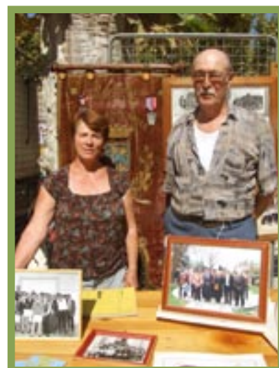
Stand de la Philharmonique

Le folklore est encore vivant grâce à Li gent dou bres (les gens du berceau) . Issue de la tradition et du terroir, cette association provençale œuvre pour maintenir, promouvoir et développer la langue et la culture provençales : rencontres, théâtre amateur (pastorale), cours de langue, danses et tambourinaires... Au-delà du folklore, une culture et un conseil aux futurs bacheliers : choisissez l'option « provençal », vous avez tout à y gagner !