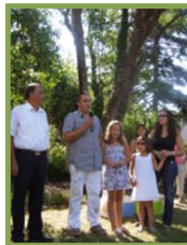
Le maire a invité les nouveaux mazanais à venir se présenter

Cet ensemble associatif, édifice imposant, est soutenu, plus ou moins solidement, par des dizaines de bénévoles qui, patiemment, par passion et par conviction, y consacrent temps, attention et dévouement. Force est de souligner le mérite de ces encadrants, à un moment où le bénévolat accuse un retrait et où, nouveau péril en vue pour les associations, les subventions se réduisent comme peau de chagrin. L'Etat,