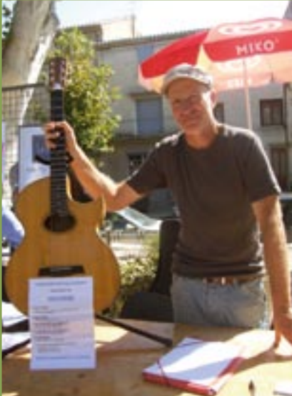
Le stand « Faites de la musique »